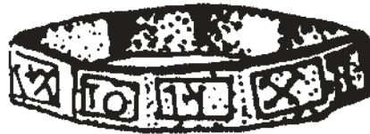
Magyar rovásírásos gyűrű - ezüstözött bronz. Lelőhelye: Pusztatemplom, XII. sz.

Sárosd Nagyközség címere visszavezethető mezővárosi rangra emeléséig, ugyanis Mária Terézia 1761. október 20-án pecsétet is adományozott a településnek. Ez a pecsétkép vált a címer alapjává. Sárosd címere: csücskös talpú, csücskös csapott, álló pajzs, melynek zöld mezéjében, a pajzstalp magasságában vörös halászcsonak orra enyhén jobbra fordulva lebeg, benne a cölöp helyén jobbra forduló gólya áll. A pajzsfőben hátulról -