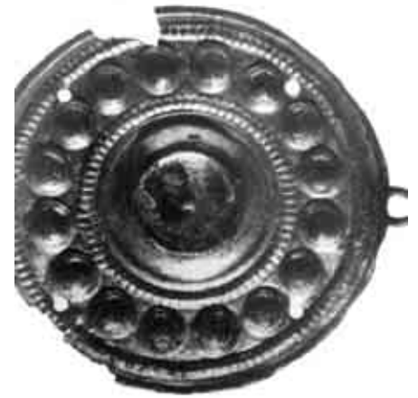
Jász ruhadíszító korong - arany. Lelőhelye: Pusztatemplom, XIV. sz.

Kevésbé világos a gólya szerepe, bár egy ilyen helyen gyakori madár lehetett, de az sem lehetetlen, hogy a mezővárossá válás korabeli földesurai (Eszterházyak)