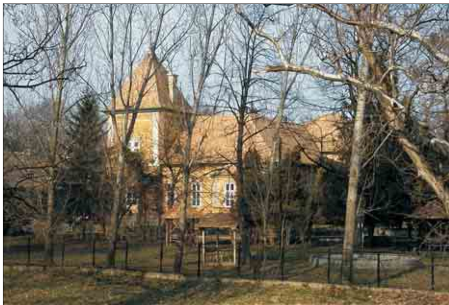
Az Eszterházy kastély

Jakabszállás a magyar középkor évszázadaiban élte fénykorát, melynek a városi rangot Corvin Mátyás király adományozta. Mátyás királyunk által kiadott oklevél szerint Jakabszállás várossá emelése - és ezzel együtt a vásártartás kiváltsága - anyjának, Szilágyi Erzsébetnek kérésére történt. Az oklevélben olvasható, hogy az uralkodó a település népének, lakóinak javát és hasznát tekintette, amikor évi három országos vásárt engedélyezett számára. Az országos vásárokat Szent Péter apostol székfoglalásának ünnepén, (február