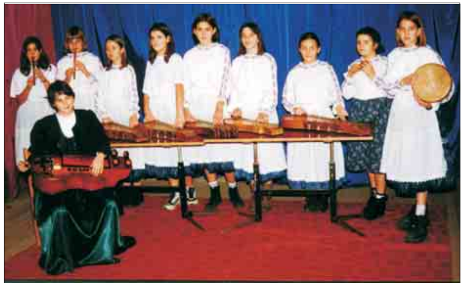
A Melence együttes

népzenei fesztiválon öregbítette Sárosd hírnevét.