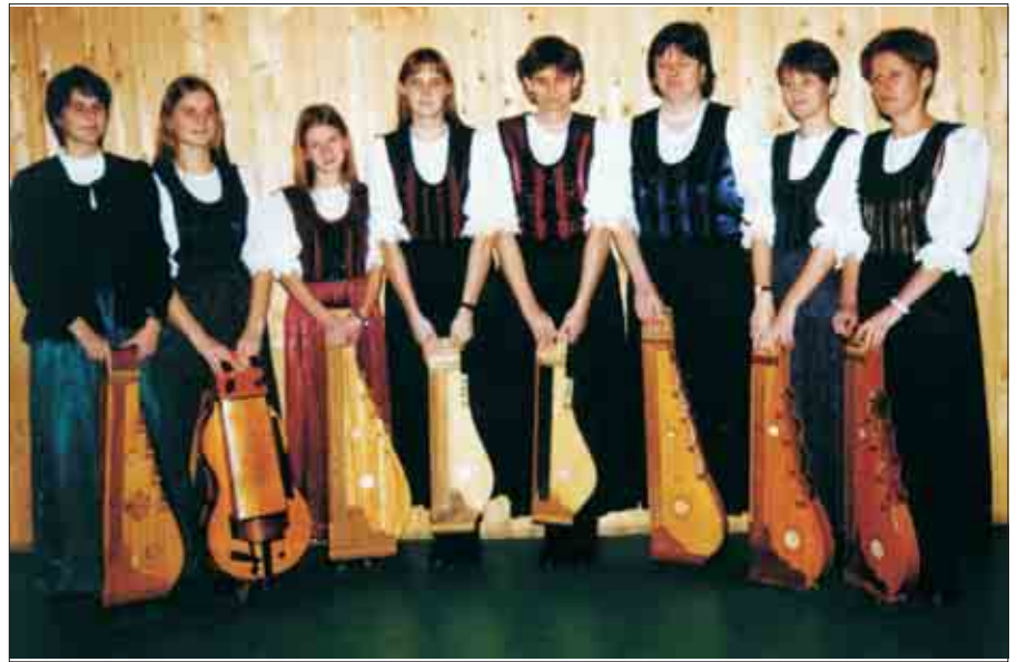
A Boglya együttes