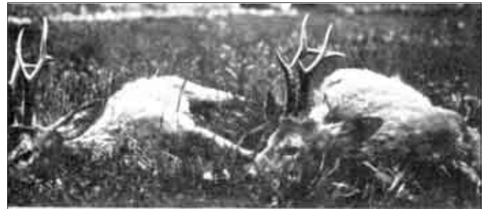
Két jó sárosdi őzbak

„... sógoromnak 1932 tavaszán ... félkilós agancsú, háromszáztizenöt nádlerpontos, rendkívüli bakot sikerült elejtenie Sárosdon. A pesti kiállításon aranyérmes első díjat nyert az a nagy bak – fényképe különös díszke könyvemnek. ”