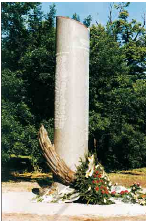
A II. világháború áldozatainak emlékműve a Kápolna dombon

terjedni a Fejér megyei uradalmakban, de a gazdaságstervezés területén végzett munkáit is példamutatónak tekintették. Meghonosította a tejtermelést, s a kiváló gyapjúhozamú juhtenyésztést továbbfejlesztette. 1851-ben beutazta Angliát, s ott cséplőgépet és gőzekét vásárolt. Az uradalom reformkorban megkezdett modernizálása az 1850-es évek elején is folytatódott. Horhy a homoktalaj megkötésére erdőt és szőlőt is telepített.